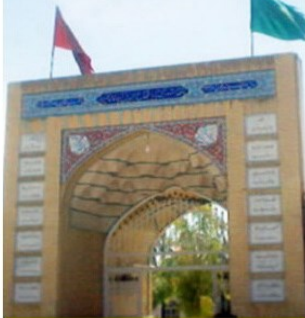
قاتل سيدنا عمر بن الخطاب

يَدْعُونَ الإسلام وَيَقْدَسُونَ قاتل سيدنا عمر بن الخطاب فأين هم من الإسلام وأين المسلمين منهم؟! .