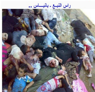
راس النبع - باتياس ..

أنت من طرطوس؟؟؟ ولك عبيد ريك عبيد 15,182 تعجب بهذا. منذ 2 ساعات