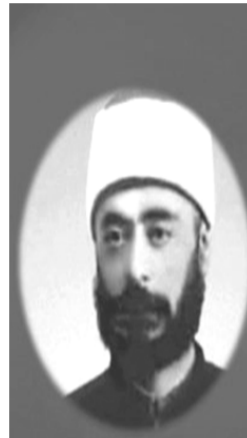
عبد الرحمن الكواكبي طبايع الاستبداد ومصارع الاستعباد

الاستبداد يقلب الحقائق في الأذهان ، فيسوق الناس إلى إعتقاد أن طالب الحق فاجر، وتارك حقه مطيع، ولشيتكي للمتظلم مُفسد، والنجيب المدقق مُحَد، والخامل لسكين صالح، ويصبح - كذلك - النصح فضولاً، والغيرة عداوة، والشهامة عنوياً، والحمية حماقة، والرحمة مرضاً، كما يعتبر أن النفاق سياسة والتحايل كياسة والدناءة لطف والندالة دماثة!