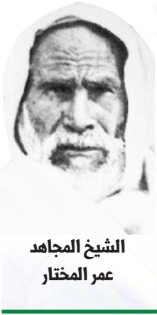
الشيخ المجاهد عمر المختار

إن الظلم يجعل من المظلوم بطلا، وأما الجريمة فلا بد من أن يرتجف قلب صاحبها مهما حاول التظاهر بالكبرياء