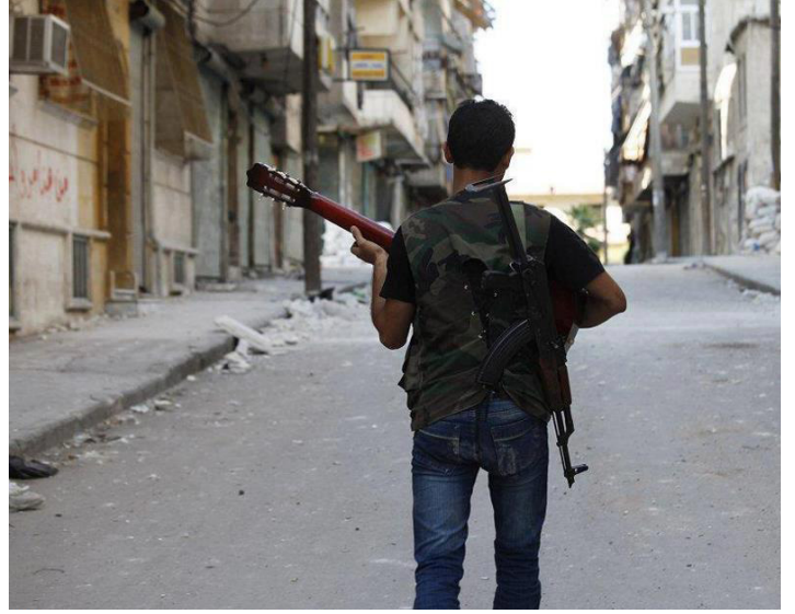
حلب - مقاتل من الجيش الحر يعزف لحن الحرية بالغيترار والروسية