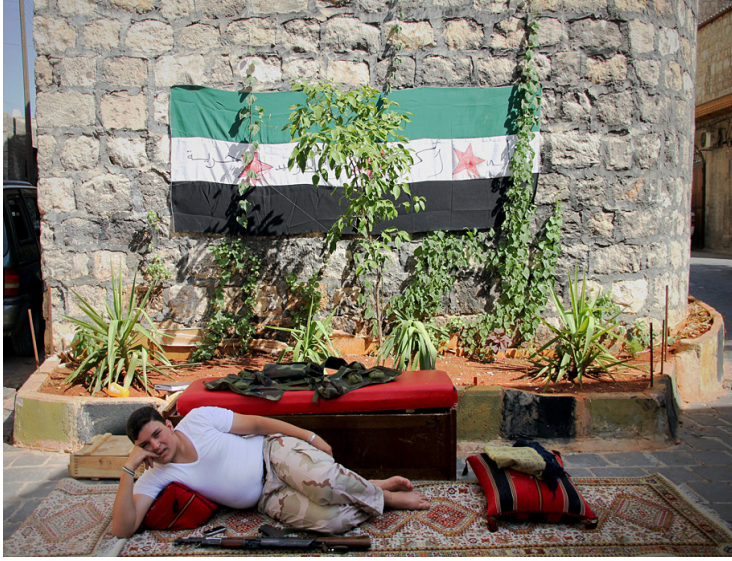
حلب - استراحة محارب