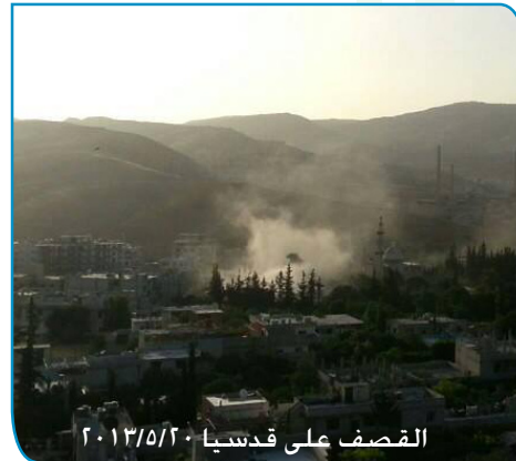
القصف على قدسيا ٢٠١٣/٥/٢٠

دولياً يستمر التحضير لمؤتمر السلام المزعوم (جنيف 2) الذي يشاع أنه سيبقي الأسد ن 2014 وسيحافظ على النظام بعسكره ومخابراته