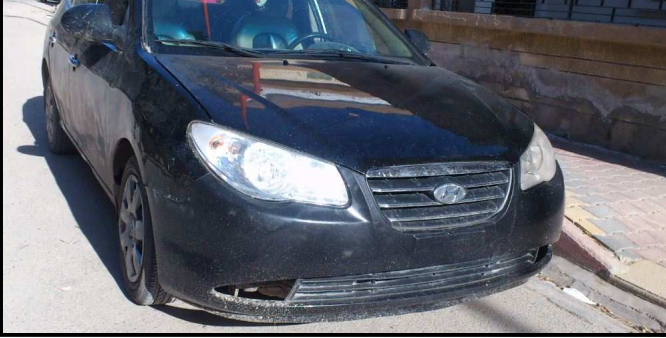
صورة لإحدى السيارات غير المنمرة

حدثت بسبب وجود هذا النوع من السيارات العسكرية غير المنمرة، حيث روى أحد أصحاب المحال التجارية المتواجدة