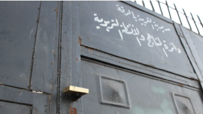
إحدى الدوائر الحكومية المغلقة

بدأ المجلس المحلي الثالث عمله في مدينة الرقة منذ ثلاثة أسابيع، ولا تزال مؤسسات الدولة معطلة منذ خمسة شهور، بالرغم من تفاؤل بعض الأهالي بقدرة المجلس الجديد على تفعيلها.