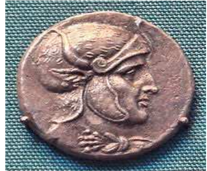
عملة معدنية نُقش عليهما صورة سلوقس الأول

أنشئت الرقعة عام 244 أو 242 قبل الميلاد وسميت في البداية كالنيكوس، نسبة إلى سلوقس الأول، مؤسس المدينة، الذي كان يعرف أيضاً بهذا الاسم (ويقول البعض أن الاسم يعود إلى الفيلسوف اليوناني كالنيكوس الذي يعتقد أنه توفي في الرقعة).