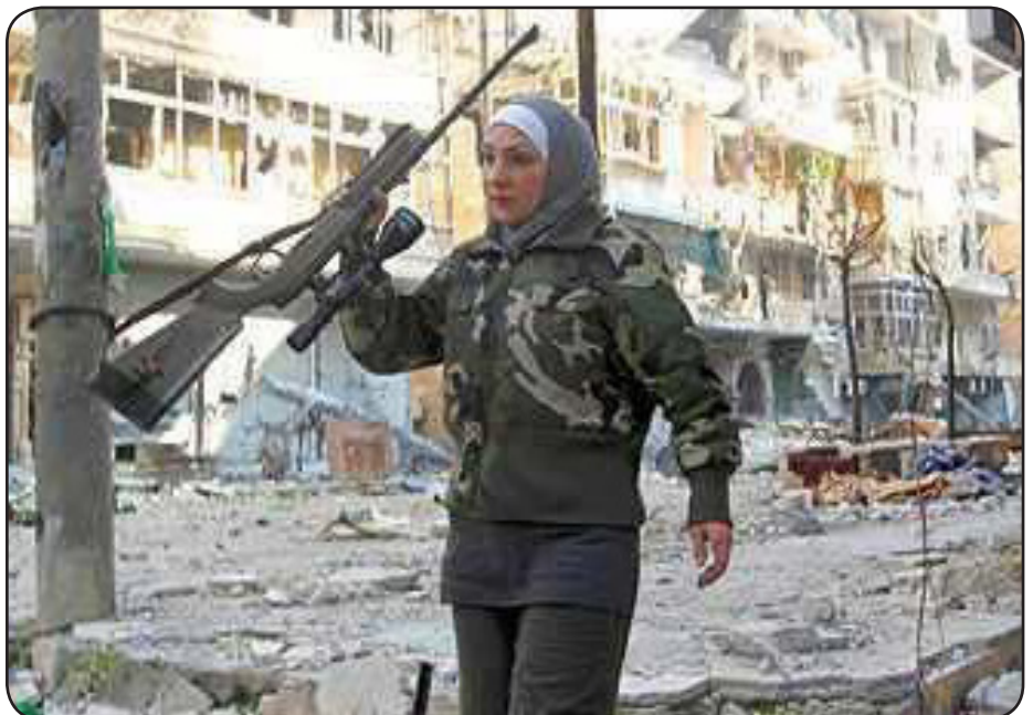
جيفارا - قناصة في حي صلاح الدين ببلد

تبعته الملائم أول (أميرة عرعور) التي انشقت في الرابع والعشرين من كانون الأول، بعدما كانت تتبع لمرتبات التجنيد والتعبئة بالمنطقة الشمالية في جيش الأسد، ثم أعلنت عن تشكيلها كتيبة الأقصى المبارك التابعة للجيش السوري الحر بجميع مجالسه العسكرية.. وحسب ما أعلنت العرعور، فانشقاقها وقيادتها كتيبة للجيش الحر ليس إلا رداً على ارتكاب جيش الأسد أبشع الجرائم ضد المدنيين العرّز.