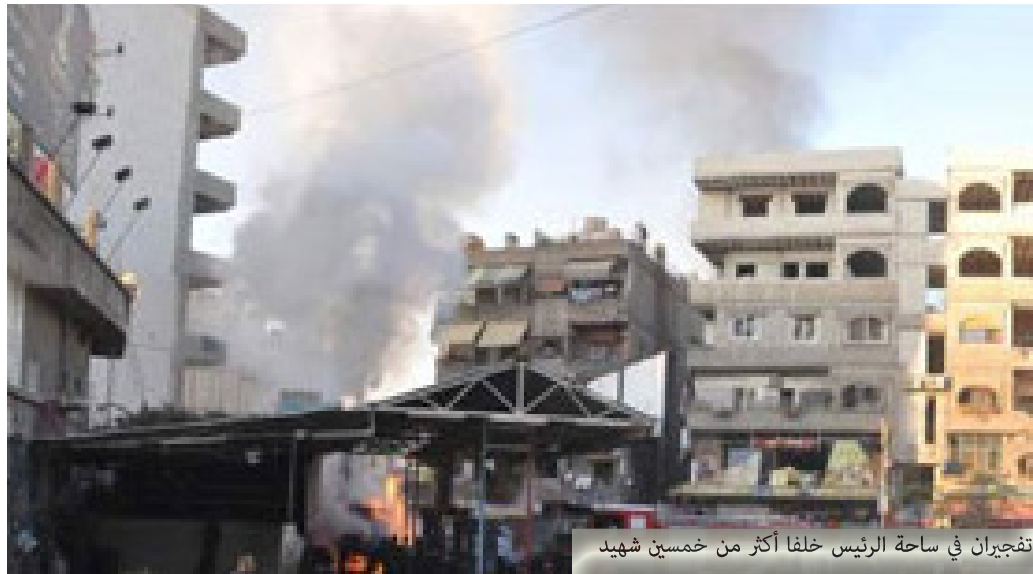
تفجيران في ساحة الرئيس خلفا أكثر من خمسين شهيد

سقطت منذ يومين ثلاثة قذائف هاون على مركز انطلاق «البولمان» إلى السويداء، فاستشهد أربعة مواطنين وجرح أكثر من عشرين، لم يتأثر المارة كثيراً بالحدث رغم أن أصوات سيارات الإسعاف تملأ المكان، ردود أفعالهم لم تكن بمستوى الحادثة، الكل تابع مسيره وحديثه، ومن كان يضحك استمر بذلك، لقد أصبح الأمر واقعاً يومياً،