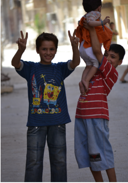
أطفال من دير الزور

تبدو كالأم ترعاه وتحيطه بعنايتها. حين حاولت المشرفة إقناعها باللعب آثرت احتضان أخيها، حتى أقبل الأخ على اللعب، فاستسلمت هي لطفولتها وشرعت تمرغ أصابعها الصغيرة بالطين.