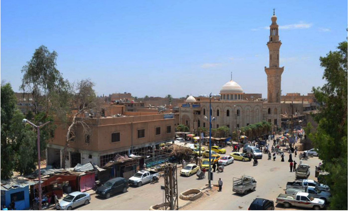
البوكمال - ساحة الحرية | عدسة نوار | خاص عين المدينة

ثابت لربطة الخبز في مدينة البوكمال. ولا بد من توجيه الشكر إلى أبناء البوكمال المغتربين في الخارج، الذين كانوا الداعم الأول للمجلس في رعاية الأفران وفي أعمال المجلس الأخرى. أثبت المجلس المحلي للبوكمال قدرته الكبيرة على إدارة المدينة وإعادة تشغيل مؤسساتها الخدمية والاقتصادية المختلفة. وهو بذلك يحتل موقعا متميزا على قائمة المجالس والهيئات الشبيهة، على مستوى المناطق والمدن المحررة. وإن تجربته المميزة ربما تدفع مجالس محلية حديثة النشأة، في مناطق أخرى، إلى الاطلاع على تفاصيل عمله وأدائه. ففكرة المجالس المحلية قد قامت بالأصل على تبادل الخبرات والتجارب وتطوير أساليب العمل بدنياميكية تناسب إدارة شؤون المناطق المحررة وتأمين احتياجات أهلها المعاشية والإدارية في ظل الأحوال المؤقتة التي تعيشها هذه المناطق، حتى نشوء سلطة مركزية بديلة قادرة على القيام بهذه المهام.