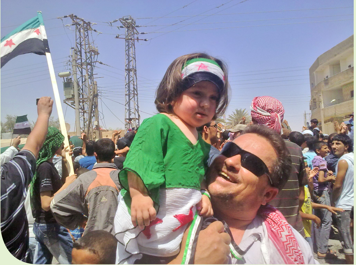
عدسة كمال - العشارة | خاص عين المدينة