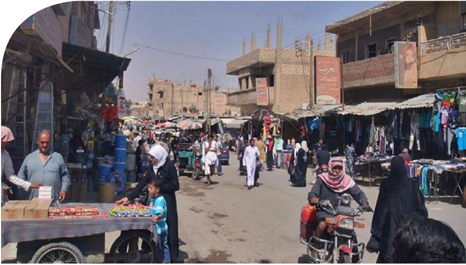
جانِب من سوق الميادين | عدسة عبود | خاص عين المدينة

وعلى مائدة الإفطار في منزل أحد ناشطي مدينة الميادين كان هناك رمضان آخر، نقاشاتٌ سياسيةٌ وثوريةٌ وديّةٌ بين ناشطين ومقاتلين من توجهاتٍ سياسيةٍ مختلفة، جمعتهم الثورة وفرقتهم توجهاتهم،