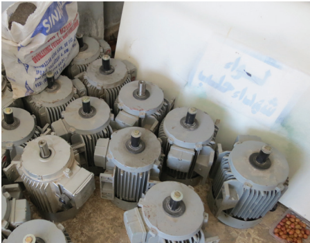
مواد مهربة - خاص عين المدينة

انه اضطر للعمل بتهريب المازوت ليؤمن قوت عياله، ويضيف المهرب المبتدئ إنه فتش كثيراً عن عمل بدون جدوى، فاضطر إلى صناعة التهريب، واختص بالمازوت الذي قد يتجاوز ثمن الليتر الواحد منه 200 ليرة.