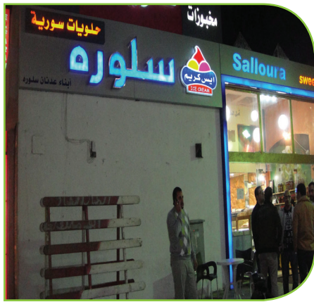
القاهرة - خاص عين المدينة

ويمكن ملاحظة مستويين من اللاجئين السوريين في مصر، المستوى الأول هو ذلك الذي فرّ بجلده من الموت بعد أن فقد أية إمكانية للبقاء في سوريا، بعد أن تهدم بيته وباتت حياته في خطر، وبشكل هؤلاء الشريحة الأكبر من اللاجئين، أما المستوى الثاني فهو طبقة من رجال الأعمال والتجار والصناعيين الذين أفقدتهم الأزمة أرباحهم، ورفاهيتهم فنقلوا سكنهم وأعمالهم إلى مصر، ويقطنون في الأحياء الراقية مثل الرحاب ومدينة نصر «ومدينتي» و الزمالك