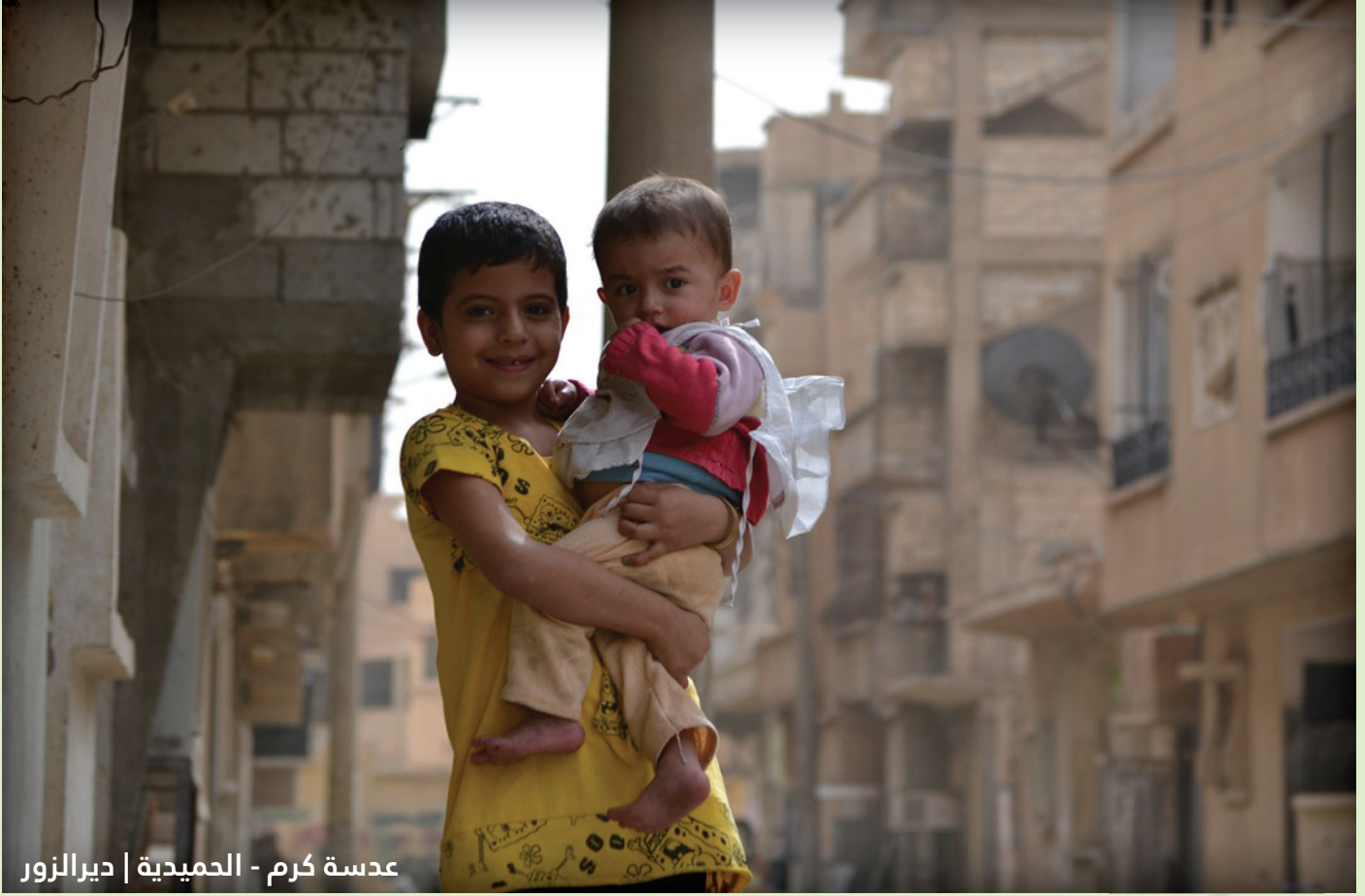
عدسة كرم - الحميدية | ديرالزور