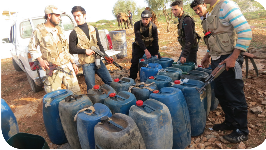
مازوت مهرب بقبضة لواء الحدود