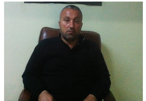
قائد لواء صقور الاسلام