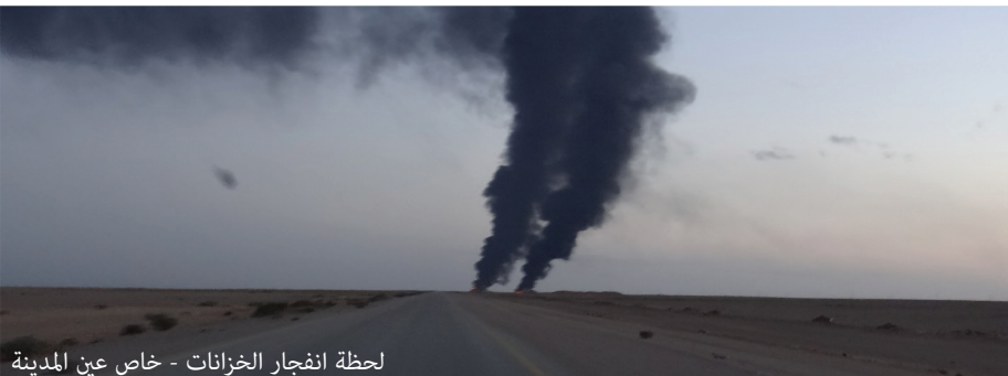
لحظة انفجار الخزانات - خاص عين المدينة

«لقد كانت أيام المهلة الستة صعبة جداً علينا وذلك بسبب تواجد عناصرنا في صحراء قاحلة وبعيدة عن المدينة حيث يشح الماء والطعام، وقبل الاقتحام بيومين بدأ الطيران المروحي يطلع علينا ليلاً لضرب قنابل فسفورية لم تؤدي حينها إلى إصابات، كما قامت المروحيات بإلقاء أربعة براميل متفجرة علينا لكن لم تصب أحداً».