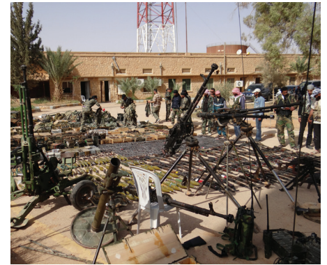
غنائم الجيش الحر - خاص عين المدينة

وهو صحفي مستقل غطى هذه المعركة «كان بإمكان الجيش الحر السيطرة بسرعة أكبر على هذه المحطة إلا أن وجود المدنيين أضر هذه العملية، وعندما بدأت عملية الاقتحام فجر النظام خزانات النفط الرئيسية في المحطة في هذه اللحظة أحسست بأن النظام قد انتهى مهما حاول أن يفعل للمحافظة على الحكم»