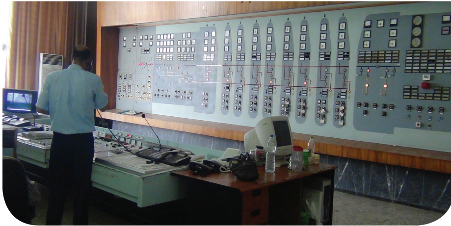
من غرفة التحكم في جسم السد - خاص عين المدينة