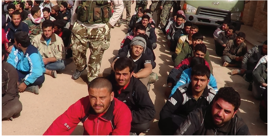
الأسرى من قوات الأسد - خاص عين المدينة

وعبر الاسلكي توصل الينا الضباط على أن يخرجوا أحياء، ولقي هذا الاقتراح قبولاً من طرف القائد محمد العظيمة أبو عبد الله «رحمه الله» وذلك حقناً للدماء، وعلى أمل انشقاق أكبر عدد من الجنود، أوقفنا اطلاق النار على مبنى الهجانة وتوجهت دباباتنا إلى مبنى الامن العسكري وزادت من حدة القصف عليهم مما أجبرهم على الفرار خارج المبنى الذي تحصنوا به