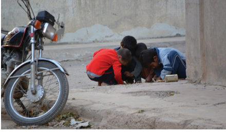
عدسة كرم - خاص عين المدينة