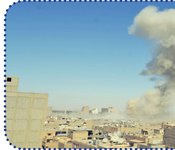
لحظة قصف