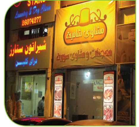
القاهرة - خاص عين المدينة

كان أبو وليد يملك محلاً كبيراً لصناعة الحلويات السورية المميزة