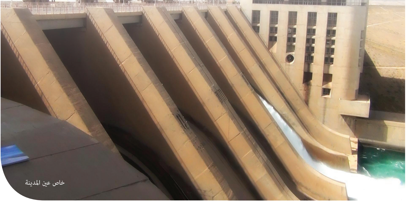
خاص عين المدينة

في العاشرة من مساء يوم الخميس الموافق ٢٠١٣/٢/٧ بدأت معركة «العلم» وهو اسم الدوار في مدخل الطبقة الرئيسي، حيث تمركزت قوات الأسد منذ عدة شهور لتتحكم سيطرتها على المدينة. وفي المعركة التي استُخدمت فيها مختلف صنوف الأسلحة من دبابات ومدركات ومضادات طيران، تلقت قوات الأسد هزيمة نكراء، فمع طلوع شمس الجمعة رفر علم الاستقلال مكان علم النظام على ذات السارية في منتصف الدوار، ولم تفلح طلعات الميخ ولا براميل الحوامات في ثني الثوار عن دخول الطبقة والتي أصبح تحريرها حين ذاك مسألة وقت. ومع احتدام المعركة في المدينة، تراجع المجموعات الأمنية للتحصن في مقراتها، وخلال ثلاثة أيام دخلت كتائب الجيش السوري الحر الطبقة، ونفذت على الفور حصاراً محكماً على المقرات الأمنية التي تساقطت تباعاً بأيدي الحر، حيث استسلم قادة وعناصر فرع الأمن العسكري، وكذلك فعل الجنود والضباط المتحصنين في مقر قيادة المنطقة، ومن على ضفة البحيرة خلف سد الفرات الشهير انهارت كتيبة المدفعية بكاملها وهام جنودها وضباطها على وجوههم حيث ألقى بعضهم بنفسه في مياه البحيرة في مشهد لن ينساه أهالي المدينة، خاصة وأن تلك الكتيبة طالما أمطرت بيوتهم وغرف نومهم وشوارعهم بقذائفها المرعبة.