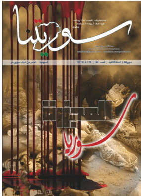
سوريقتنا - العدد الرابع والثمانون - 2013-4-28