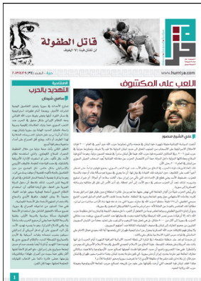
حريات - العدد الثامن والأربعون - 2013-4-29