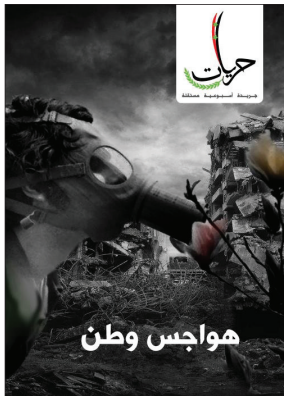
حريات - العدد الثامن والأربعون - 2013-4-29