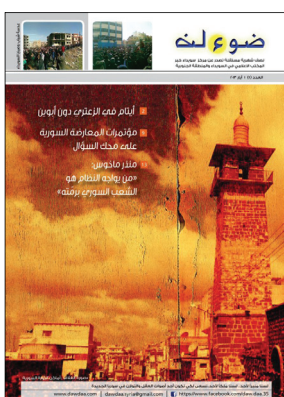
ضوضاء - العدد الأول - 2013-5-1