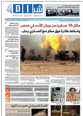
شام - العدد الثالث عشر - 2013-4-29