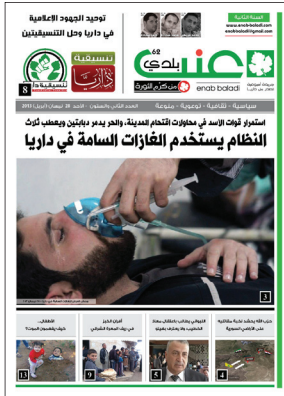
عنب بلدي - العدد الثاني والثمانون - 2013-4-28