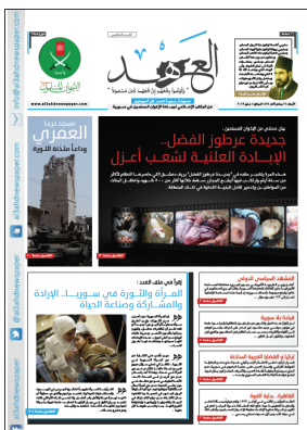
العهد - العدد الخامس - 2013-5-1