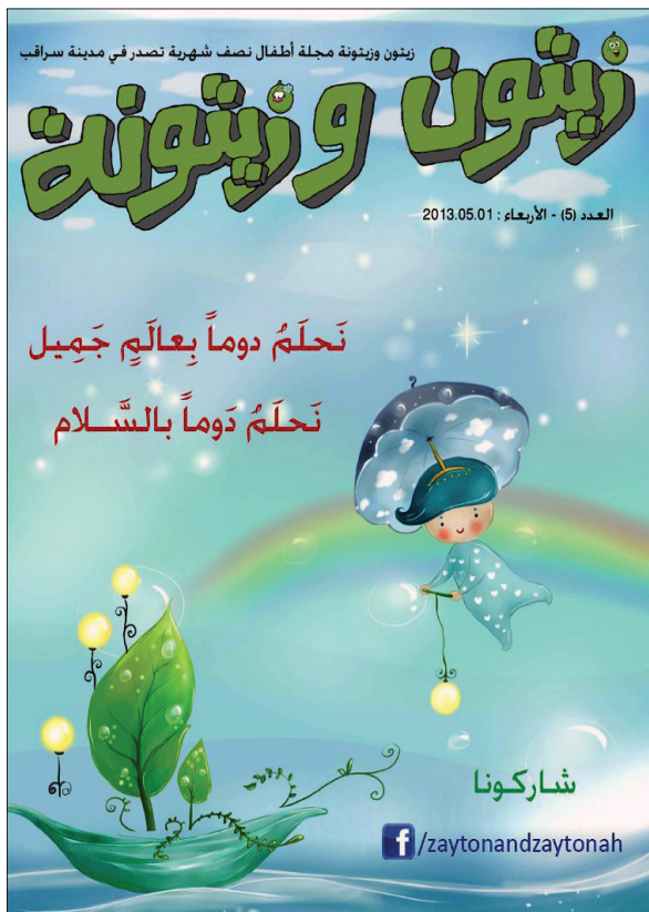
زيتون وزيتونة - العدد الخامس - 2013-5-1