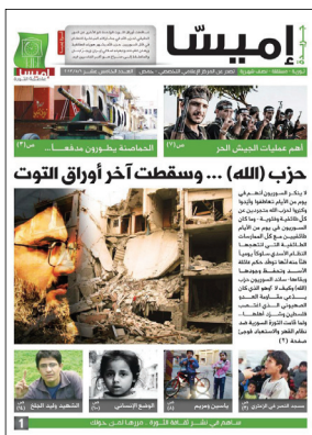
إميسا عاصمة الثورة - العدد الخامس عشر - 2013-5-1