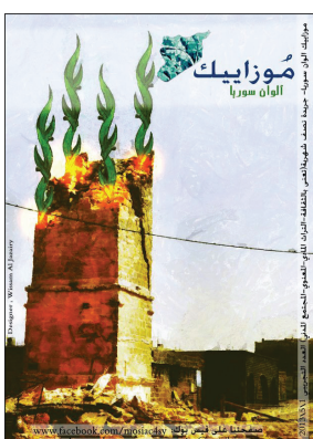
موزاييك - العدد الأول - 2013-5-1