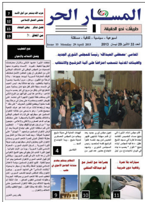
المسجد الحر - العدد الثالث والثلاثون - 2013-4-29