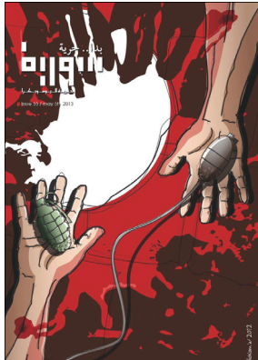
سوريا بدأ حرية - العدد الخامس والخمسون - أيار 2013