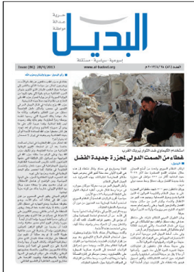
البديل - العدد السادس والثمانون - 2013-4-28