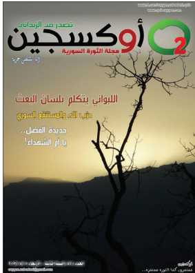
أوكسجين - العدد السادس والخمسون - 2013-5-1