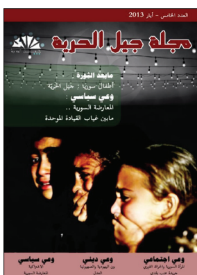
جبل الحرية - العدد الخامس - أيار 2013