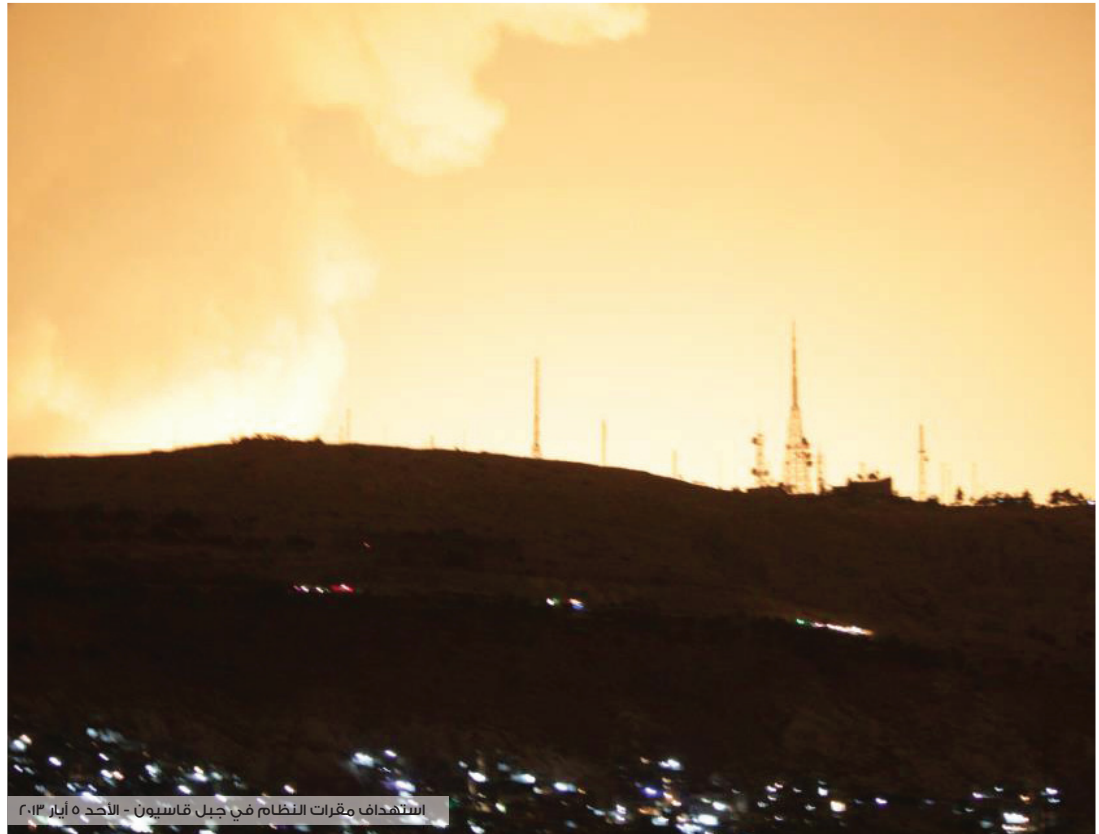
استهداف مقرات النظام في جبل قاسيون - الأحد 5 أيار 2013