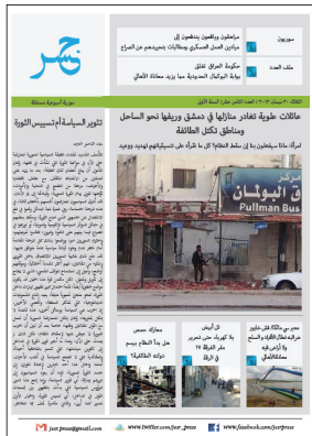
جسر - العدد الثامن عشر - 2013-4-30