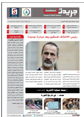
جريدتنا - العدد التاسع - 2013-4-29