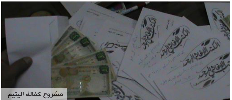
مشروع كفالة اليتيم

تحول المكتب الإغاثي الموحد إلى مؤسسة اجتماعية تنموية لا يقتصر نشاطه على توزيع الأغاثة والدعم للمحتاجين والنازحين فقط، بل يقوم باعداد مشاريع زراعية صغيرة لضمان تشغيل أكبر عدد ممكن من الناس في منطقة الغوطة الشرقية ولتوفير جزء من الأمن الغذائي للمنطقة من هذه المشاريع.