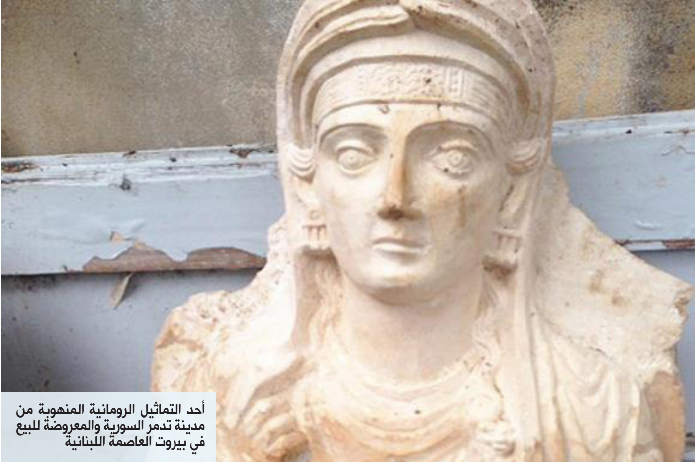
أحد التماثيل الرومانية المنهوبة من مدينة تدمر السورية والمعروضة للبيع في بيروت العاصمة اللبنانية

وقال «وليام ويبير» المتخصص في التحف الفنية «بأن الأضرار التي لحقت بالمنحوتات تبين أنها ناجمة عن تعرضها للاقتلاع من على جدران المقابر».