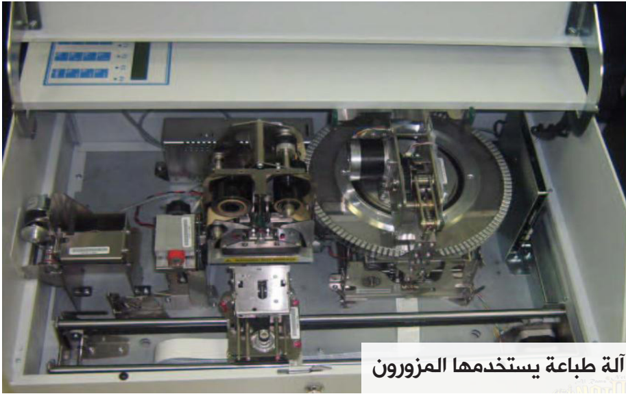
آلة طباعة يستخدمها المزورون