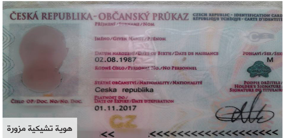
هوية تشيكية مزورة

هذا التحول في عمله ساعده على التعرف على وسط المزورين، وكما يصف حياته بأنها كلها تزوير بتزوير، فالمنزل مستأجر على أوراق مزورة والكهرباء على أوراق مزورة، ولم يقتصر الأمر على ذلك فهو استعمل لعدة مرات الوثائق المزورة للاحتيال على البنوك والحصول على قروض، وأجهزة الموبايل واللابتوب ايضاً، فيقول (د.د): في سحب الموبايلات وأجهزة اللابتوب المعروضة بالتقسيط كانت الوثائق الرومانية هي الأنجح، لكنني استعملت بعض الأحيان الكرت الأحمر (بطاقة طلب اللجوء اليونانية القديمة).