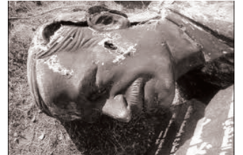
بشير - حماه

لا بد من الانتباه إلى تلك الأخطاء في التفكير على الثورة تطهرنا من الاستبداد الفكري الذي عانينا من برائته لسنوات طويلة... وما ذلك ببعيد بإذن الله.