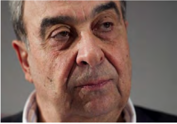
ميشيل كيلو - الشرق الأوسط