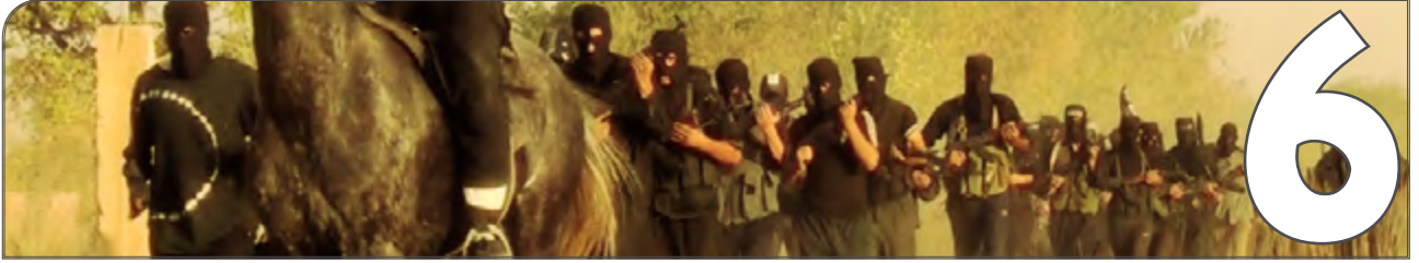
القاعدة والنصرة. . والثورة السورية. .