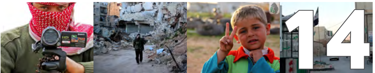
الثورة في صورة